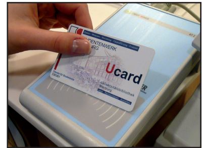
Ucard und kontaktloser Kartenleser KT 2

In kaum einer anderen deutschen Stadt prägt die Universität so sehr das Stadtbild wie in Marburg. Im Zentrum der idyllisch gelegenen Stadt koordiniert das Studentenwerk den Studienalltag der Studierenden und besticht durch einen qualitätsbewussten und vielfältigen Dienstleistungskatalog. Mit der Einführung der multifunktionalen Kartenlösung von Schomäcker Card Solutions baut das Studentenwerk seinen Service weiter aus.