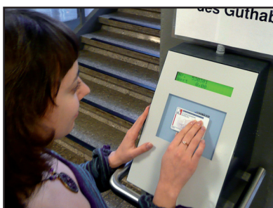
Ucard und Infoterminal